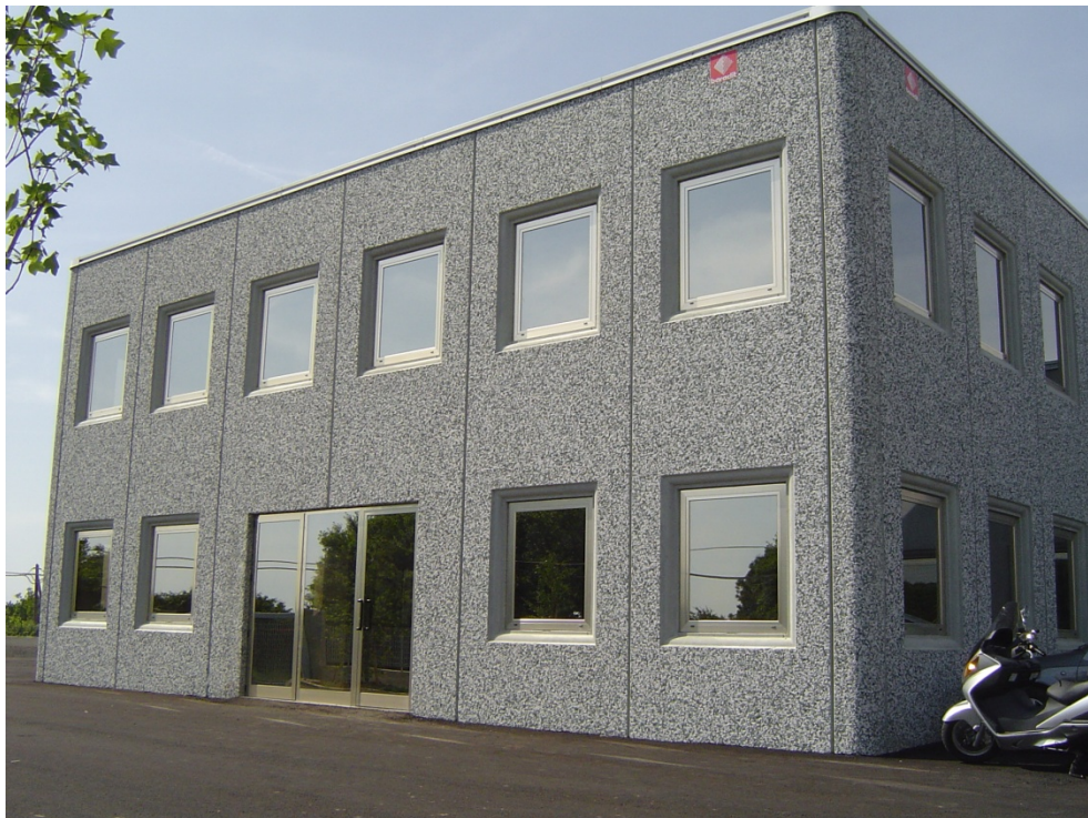
(Belli S.r.l. – impianti tecnologici)

Che il Bilancio Sociale sia un documento solo apparentemente formale, anzi prevalentemente sostanziale, perché strumento di una strategia di miglioramento dei risultati sia sociali che economici, è quanto emerso da tutti gli stakeholder presenti durante il focus group.